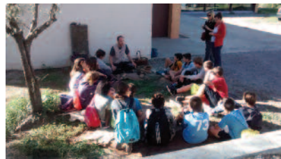
Figura 3. Tastets de prehistòria a l'Espai Orígens. Grup escolar

3- Activitats ludicodidàctiques al centre: per tal de dotar de més continguts el centre es va planificar l'oferta d'unes activitats lúdiques però amb base científica i didàctica, destinades a grups tant escolars com més familiars o més heterogenis. Es tracta dels Tastets de Prehistòria (fig. 3). Amb una sèrie curta d'activitats (encendre foc, elaborar un instrument, caçar) els participants aprenen de