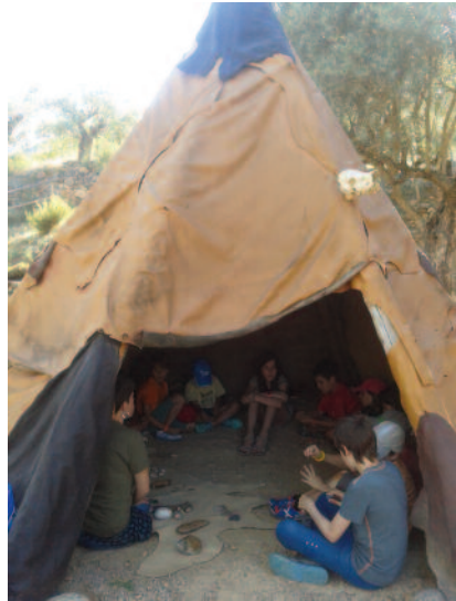
Figura 5. Tallers al Parc Arqueològic Didàctic (Sant Llorenç de Montgai)

8- Montroig, passat i present: excursió a la cova del Tabac . A través d'un recorregut per un dels extrems de la serra del Montroig es proposa un viatge en el temps a través dels vestigis que han quedat com a testimonis de la història d'aquest indret, i una immersió en el seu bell paisatge natural i geològic. Durant el recorregut, el guia va explicant diversos aspectes del paisatge, la geologia, la natura i la història. Un cop dins de la cova (fig. 6), les explicacions