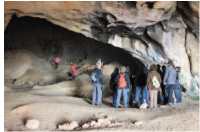
Figura 6. Visita guiada a la cova del Tabac (Camarasa)

Complementari amb el que hem explicat, creiem que era necessari que Espai Orígens fos, també, un punt d'informació turística, necessàriament amb caràcter informal, atès que Camarasa no té oficina d'informació turística pròpia. No obstant això, estem treballant