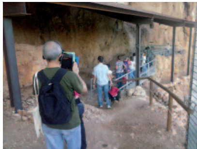
Figura 4. Visita guiada a la Roca dels Bous (Sant Llorenç de Montgai)

1- La Roca dels Bous 2.0: les activitats guiades fora del centre van iniciar-se amb les visites a la Roca dels Bous ( http://larocadelsbous.uab.cat ) amb caràcter previ a la posada en marxa de l'Espai Orígens. Després el centre es convertí en l'espai de recepció de visitants, on se'ls informa del funcionament de la visita i se'ls donen les tauletes digitals que s'utilitzen en la visita guiada (fig. 4). El jaciment es troba uns quatre quilòmetres del centre.